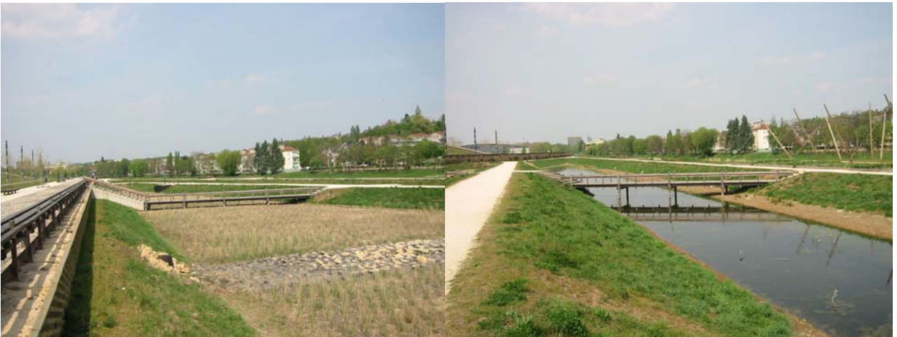
1 : vue d'ensemble, parc de la Seille 2 : jardin humide 3 : filtre planté de roseaux 4 : rétention

Montant de la mission complète de Maitrise d'œuvre : ..... 107 000 € HT