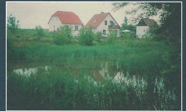
BASSIN PAYSAGER LE LONG D'UN PARCOURS D'AGRÈMENT. VILLAGE DE MÖLBIS EN ALLEMAGNE