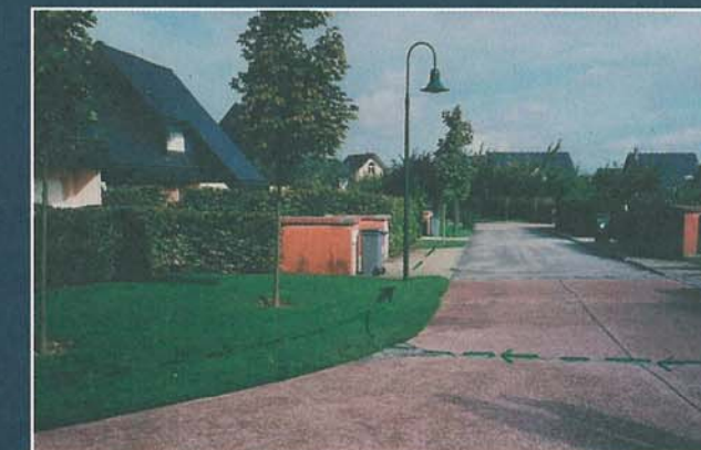
COLLECTE DES EAUX PLUVIALES PAR NOUES ENGAGONNÉES ET CANIVEAUX BOIS GUILLAUME, OPÉRATION FONCIER CONSEIL

En outre ce double usage (espace public et hydraulique) pérennise l'entretien de l'ouvrage.